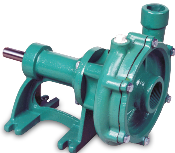
BOMBA B-715 - 1" Centrífuga