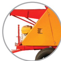
Opção de acionamento por motor ou trator. (Modelos B-150/B-150 Andina)